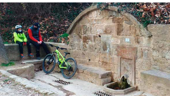
MHÀ, ESTUDI GRÀFIC · DL: L 101-2021 · FOTOGRAFIES de l'arxiu de Solsona Turisme i Turisme Solsonès. PORTADA: pont de l'Afrau (Oscar Rodbag). CONTRAPORTADA: pont de l'Afrau (Oscar Rodbag); font del Corb (Esther Santalària). INTERIOR: camí al pont de l'Afrau (Cristina Cabestany); font del Corb (Cristina Cabestany)