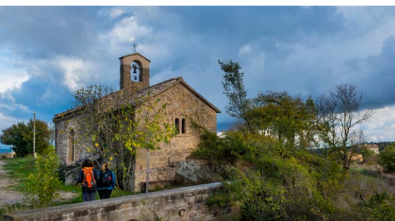
MHÀ, ESTUDI GRÀFIC · DL: L 900-2024 · PORTADA: Sant Esteve d'Olius. CONTRAPORTADA: cripta de Sant Esteve d'Olius; capella de Sant Honorat. INTERIOR: camps de conreu als Plans d'Olius

OFICINA DE TURISME DEL SOLSONÈS Carretera de Bassella, 1 - 25280 Solsona T. (+34) 973 48 23 10 - 623 172 497 turisme@turismesolsones.com www.turismesolsones.com solsonaturisme@ajsolsona.cat www.solsonaturisme.com