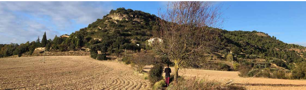
MHÀ, ESTUDI GRÀFIC · DL: L 106-2021 · FOTOGRAFIES de l'arxiu de Solsona Turisme. PORTADA: vistes a Solsona des del camí a Sant Bartomeu (Oscar Rodbag). CONTRAPORTADA: vistes del Vinyet de Solsona (Trini Pià); serrat de Sant Bartomeu (Cristina Cabestany). INTERIOR: vistes des del serrat de Sant Bartomeu (Trini Pià)